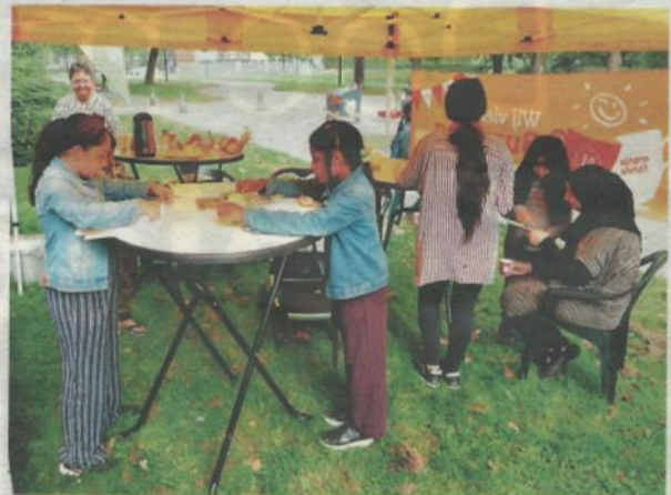
Burendag bij Ontmoetingshuis De Weerklank in Groenoord.

elkaar te ontmoeten. Onze medeflatbewoners waren daarvoor allemaal persoonlijk uitgenodigd. Burendag werd afgesloten met een warme avondmaaltijd. "Wat was het leuk en wat was het gezellig", laat de organisatie weten. "We hebben veel nieuwe gezichten gezien en zo'n veertig mensen ontvangen. Alle vrijwilligers, bedankt!"